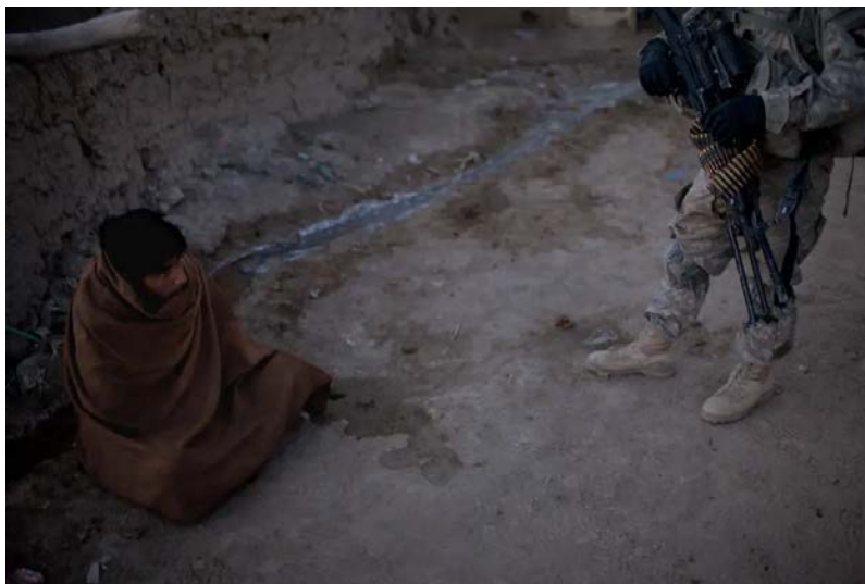
ځوانان د ښځو څخه لري پوښتل شوي. امریکایي چارواکي وايي طالبان کولای شي په سیمه کې 400 جنګیالي ځای پر ځای کړي.

سیمه ایز پوهه ډیری وخت جنګیالیو ته دا وړتیا ورکوي چې په ښکاره توګه ورک شي، په نهرونيو یا د کلیو په لارو کې تیرېږي.