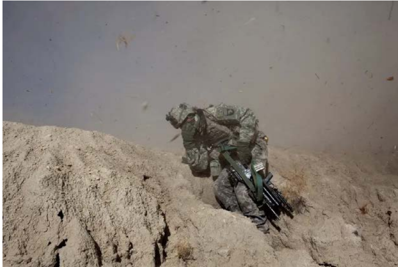
طالبان په اندرو او ده پک کې د ملاتړ شبکه لري.

ليفټننټ ميريتا وويل، د ځينو لاسي بمونو نښې نښانې بڼې چې دا د حقاني ډلې له خوا راټول شوي وو، يا د هغو کسانو له خوا چې روزل شوي او يا يې برابر کړي وو.