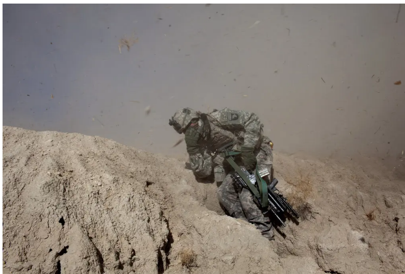
The Taliban has a support network in Andar and Deh Yak.