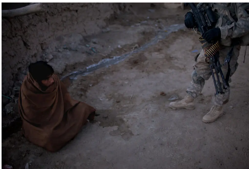
Young men were questioned away from the women. American officials say the Taliban can field 400 fighters in the region.

Local knowledge has often given the fighters the ability to seemingly disappear, slipping away in canals or village alleys.