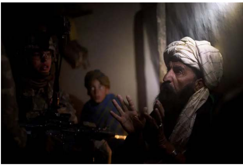
د 187 پلي لوا د درېیمې کنډک سرتېرو تېره میاشت د طالبانو د یوه مشر د نیولو په تمه په بادام خېلو برید وکړ.

مګر د هغې تحلیل، چې نږدې له پیل څخه جوړ شوی او د قوماندانانو، سرتیرو او شنونکو سره د مرکو له لارې څرګند شوی، په هرصورت، د یوې ادارې تاکتیکي، ټولنیز او بصري نقشه انځوروي چې په یو وخت کې پراخه وي مګر په ندرت سره د بهرنیانو لخوا لیدل کېږي. او دا د پنتاګون د پلان سره مخامخ د ستونزو یو څرګند یادونه وړاندې کوي چې تر 2014 پورې افغان امنیتي ځواکونو ته د دې په څیر سیمې د خپل هوډ لرونکي او ژورې رینسې سره د اورپکې سپارلو سره مخ دي.