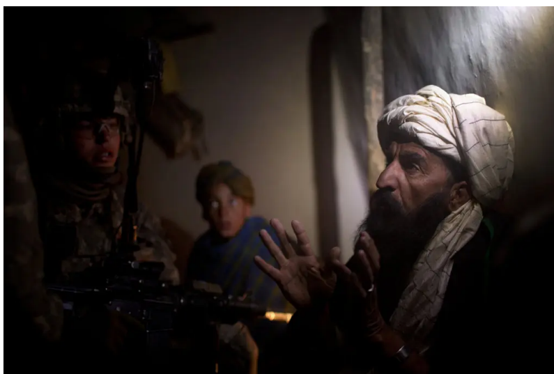
Soldiers from the Third Battalion of the 187th Infantry Regiment raided Alam Khel last month, hoping to capture a Taliban leader.

But its analysis, built nearly from scratch and revealed through interviews with commanders, soldiers and analysts, nonetheless sketches a tactical, social and visual map of an organization that is at once widespread but rarely seen by outsiders. And it presents an implicit reminder of the difficulties facing the Pentagon's plan to turn over areas like this one, with its determined and deep-rooted insurgency, to Afghan security forces by 2014.